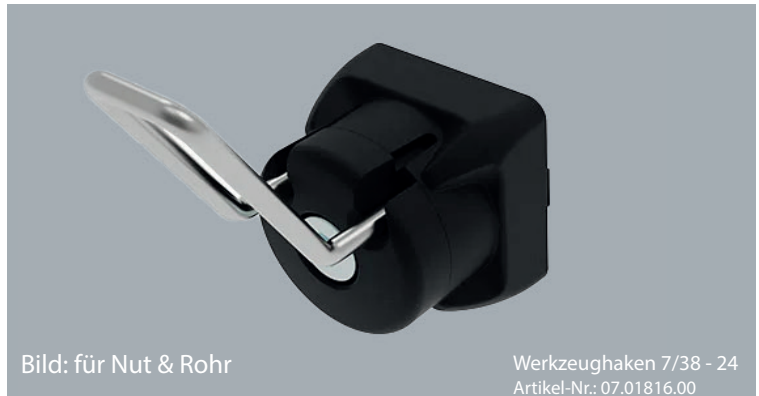
Bild: für Nut & Rohr

Werkzeughaken 7/38 - 24 Artikel-Nr.: 07.01816.00